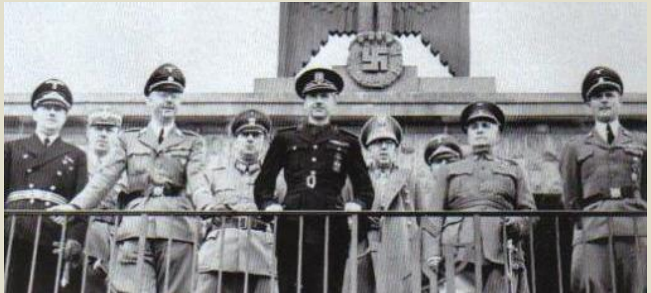
Imatges d'una visita de Serrano Suñer a Berlín, el setembre de 1940