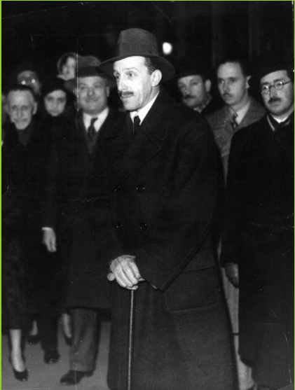
Fotografia d'Alfons XIII a Fontainebleau (França) l'any 1931

Alfons XIII va morir a l'exili a Roma el febrer de 1941.