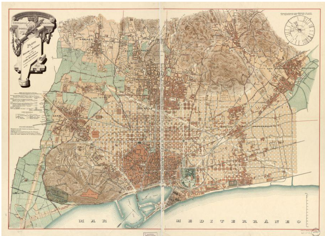
Plànol de Barcelona de l'any 1890 (J.M. Serra), i dels municipis agregats.